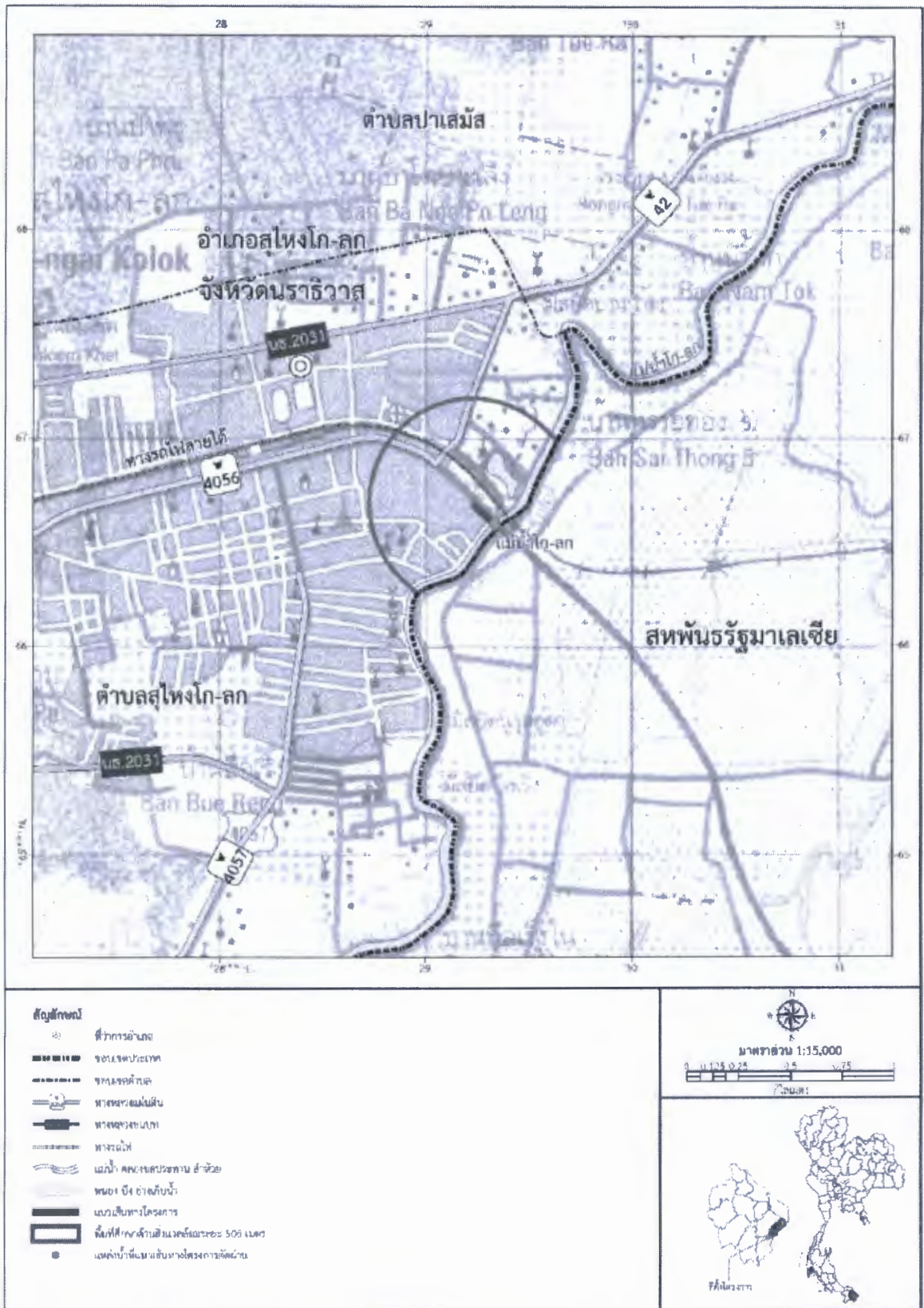
รูปที่ ๑ พื้นที่ศึกษาโครงการทางคูขนานสะพานข้ามแม่น้ำโก-ลก ที่ อ.สุโขทัย (ระยะก่อสร้าง)

Handwritten signatures and initials in blue ink at the bottom of the page.