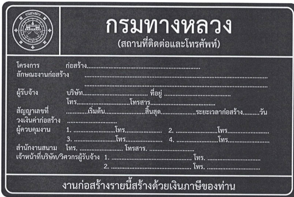
รูปที่ 2-8 ป้ายโครงการก่อสร้างขนาดใหญ่