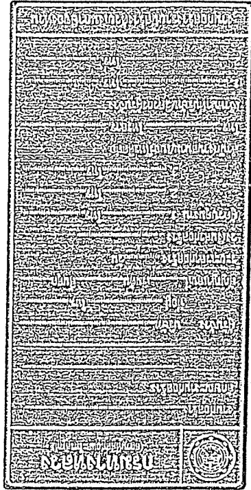
ส่วนขนาดวางผังให้ขนาดตามรูปที่ 2-7 และรูปที่ 2-8