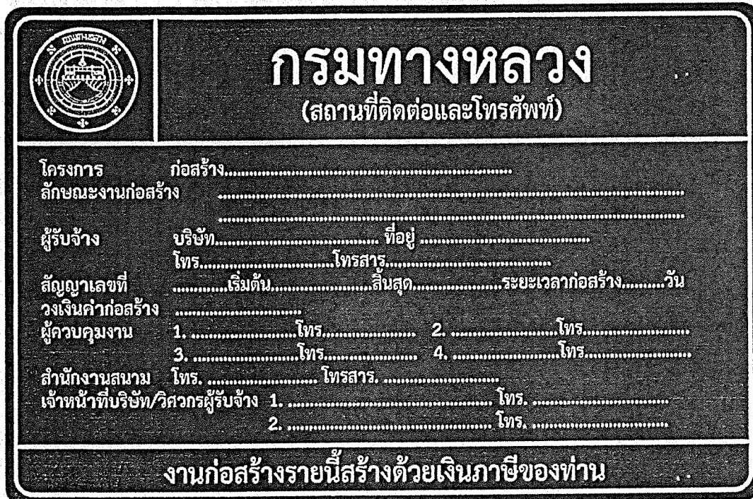
รูปที่ 2-8 ป้ายโครงการก่อสร้างขนาดใหญ่

สรุปป้ายจราจรที่ใช้ในงานก่อสร้าง งานบูรณะ และงานบำรุงรักษา ทางหลวงแผ่นดินในแต่ละพื้นที่ก่อสร้างแสดงในตารางที่ 2-1