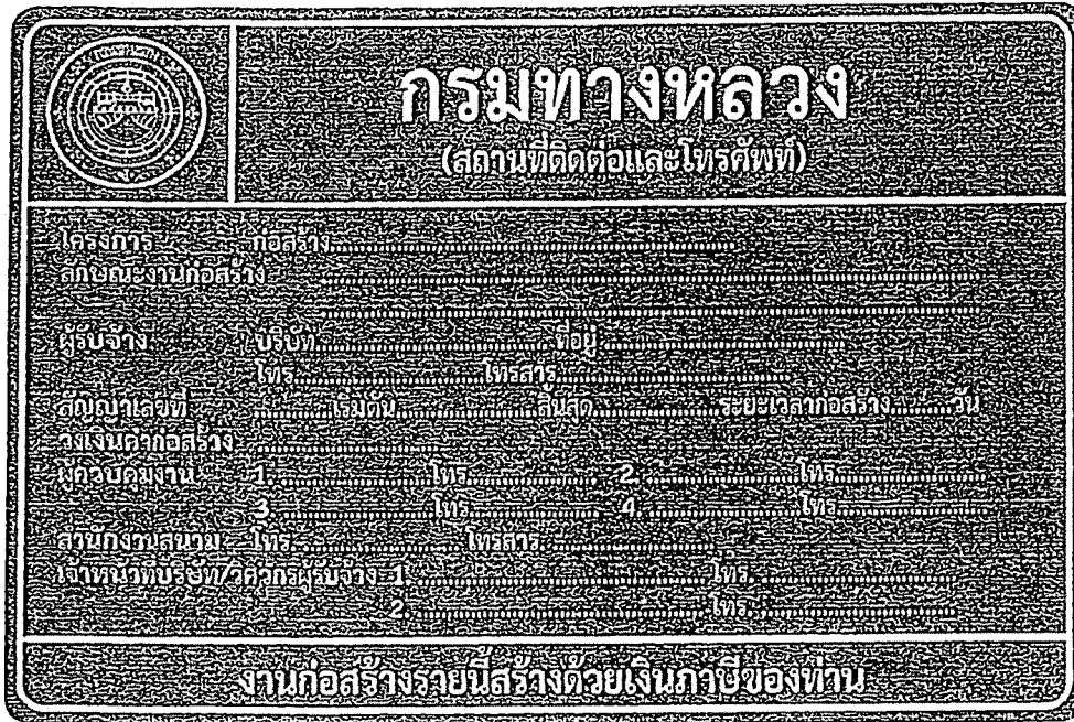
รูปที่ 2-8 ป้ายโครงการก่อสร้างขนาดใหญ่

สรุปป้ายจราจรที่ใช้ในงานก่อสร้าง งานบูรณะ และงานบำรุงรักษา ทางหลวงแผ่นดินในแต่ละพื้นที่ก่อสร้างแสดงในตารางที่ 2-1