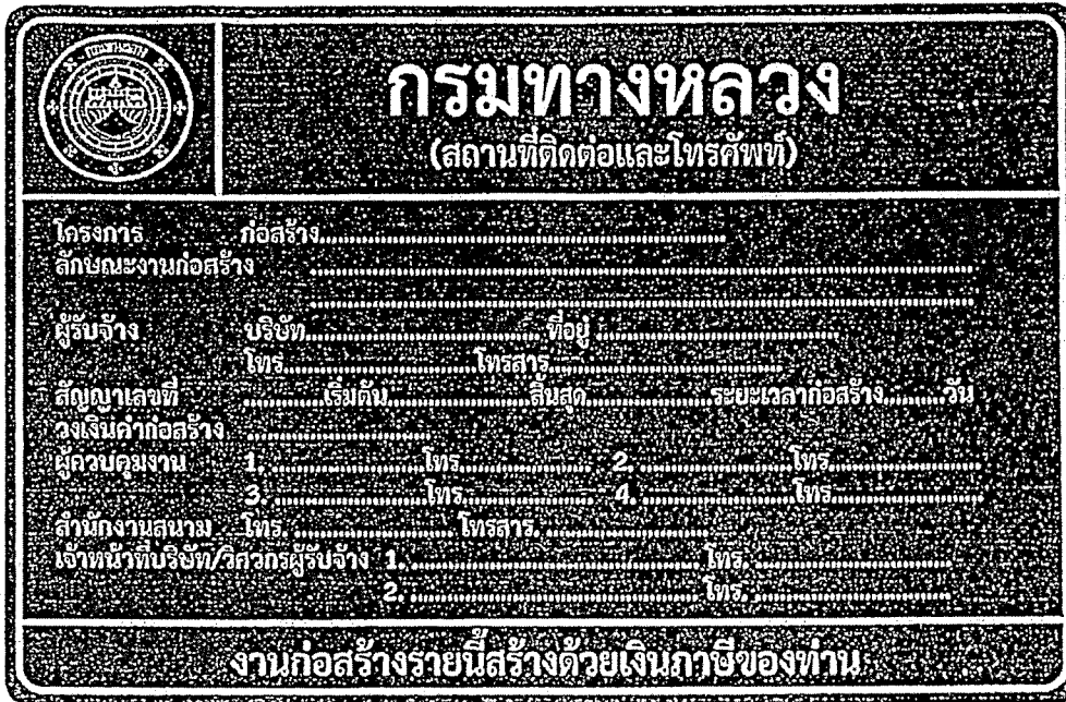
รูปที่ 2-8 ป้ายโครงการก่อสร้างขนาดใหญ่

สรุปป้ายจราจรที่ใช้ในงานก่อสร้าง งานบูรณะ และงานบำรุงรักษา ทางหลวงแผ่นดินในแต่ละพื้นที่ก่อสร้างแสดงในตารางที่ 2-1