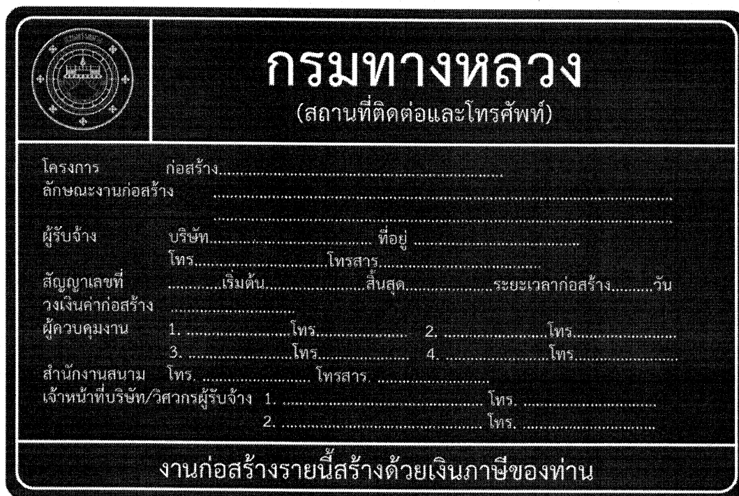
รูปที่ 2-8 ป้ายโครงการก่อสร้างขนาดใหญ่