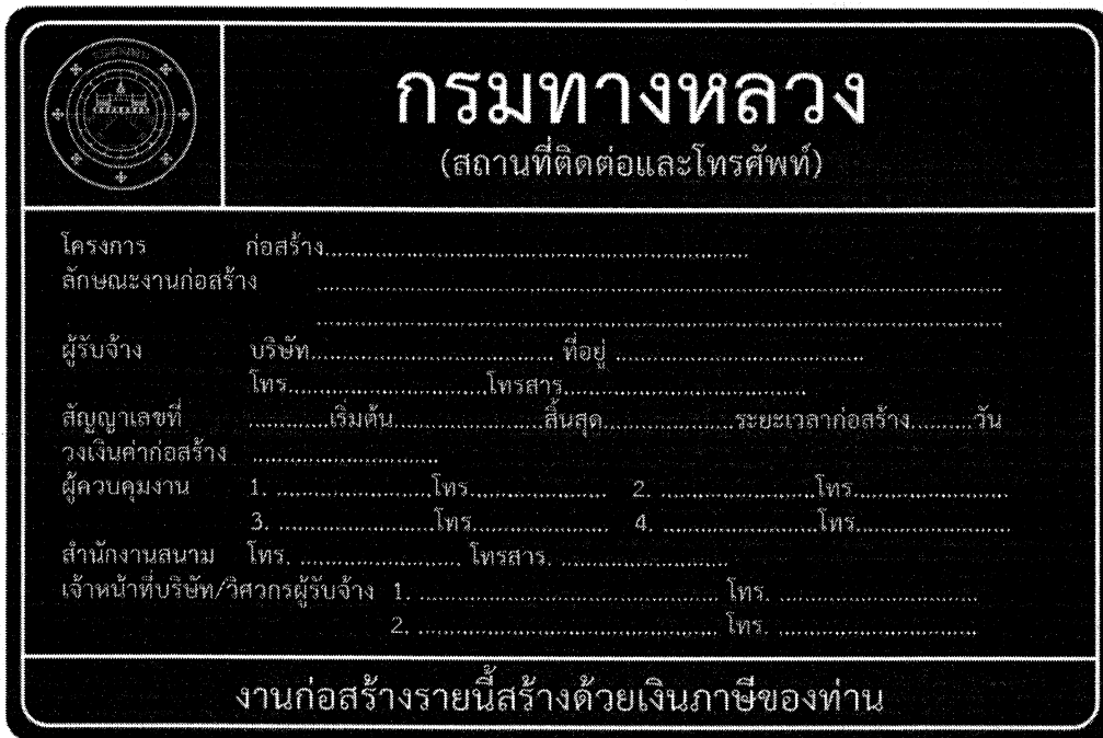
รูปที่ 2-8 ป้ายโครงการก่อสร้างขนาดใหญ่