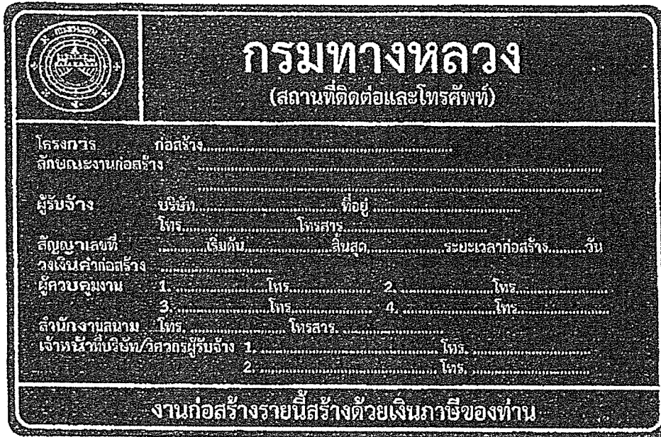
รูปที่ 2-8 ป้ายโครงการก่อสร้างขนาดใหญ่

สรุปป้ายจราจรที่ใช้ในงานก่อสร้าง งานบูรณะ และงานบำรุงรักษา ทางหลวงแผ่นดินในแต่ละพื้นที่ก่อสร้างแสดงในตารางที่ 2-1