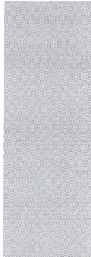
รูปที่ 2-8 ป้ายโครงการก่อสร้างขนาดใหญ่