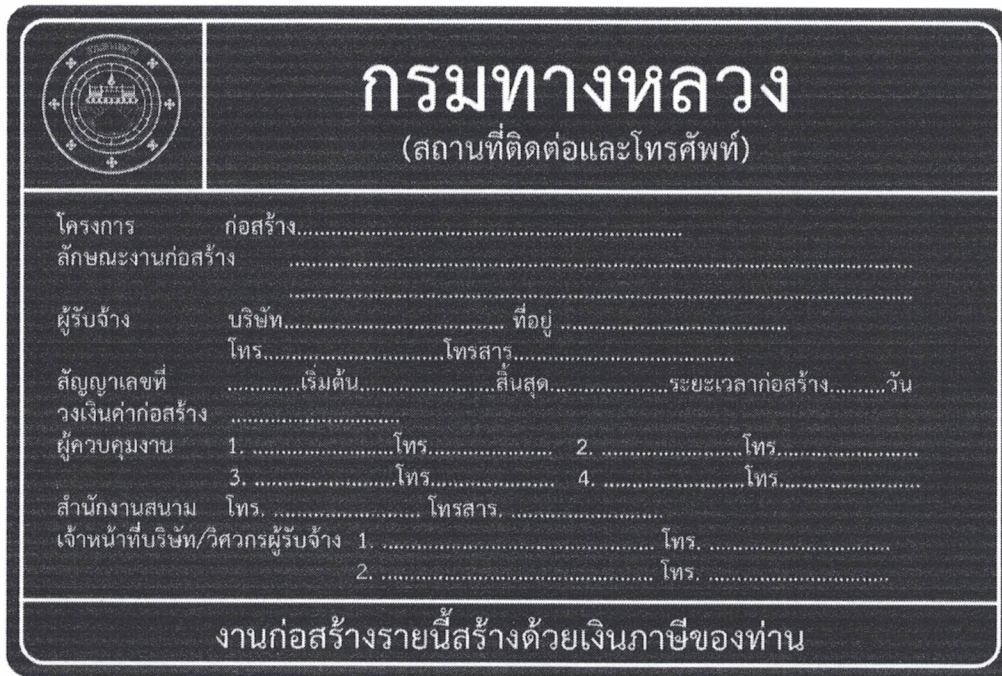
รูปที่ 2-8 ป้ายโครงการก่อสร้างขนาดใหญ่