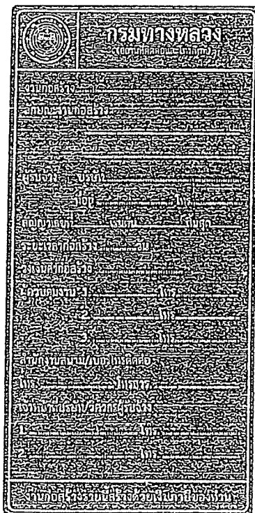
รูปที่ 2-7 ป้ายโครงการก่อสร้างขนาดเล็ก

ส่วนขนาดตัวหนังสือให้ใช้ขนาดตามรูปที่ 2-7 และรูปที่ 2-8