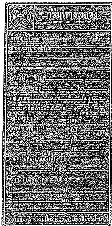
รูปที่ 2-7 ป้ายโครงการก่อสร้างขนาดเล็ก

ส่วนขนาดตัวหนังสือให้ใช้ขนาดตามรูปที่ 2-7 และรูปที่ 2-8