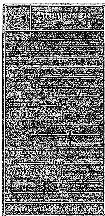
รูปที่ 2-7 ป้ายโครงการก่อสร้างขนาดเล็ก

ส่วนขนาดตัวหนังสือให้ใช้ขนาดตามรูปที่ 2-7 และรูปที่ 2-8