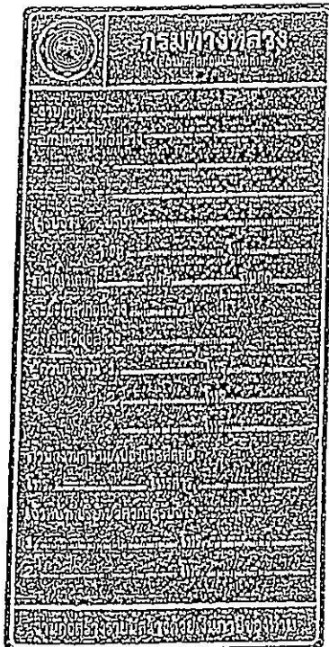
รูปที่ 2-7 ป้ายโครงการก่อสร้างขนาดเล็ก

ส่วนขนาดตัวหนังสือให้ใช้ขนาดตามรูปที่ 2-7 และรูปที่ 2-8