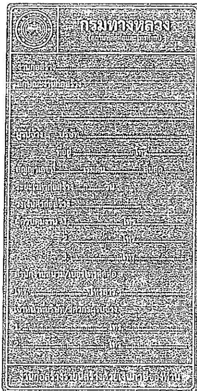
รูปที่ 2-7 ป้ายโครงการก่อสร้างขนาดเล็ก

ส่วนขนาดตัวหนังสือให้ใช้ขนาดตามรูปที่ 2-7 และรูปที่ 2-8