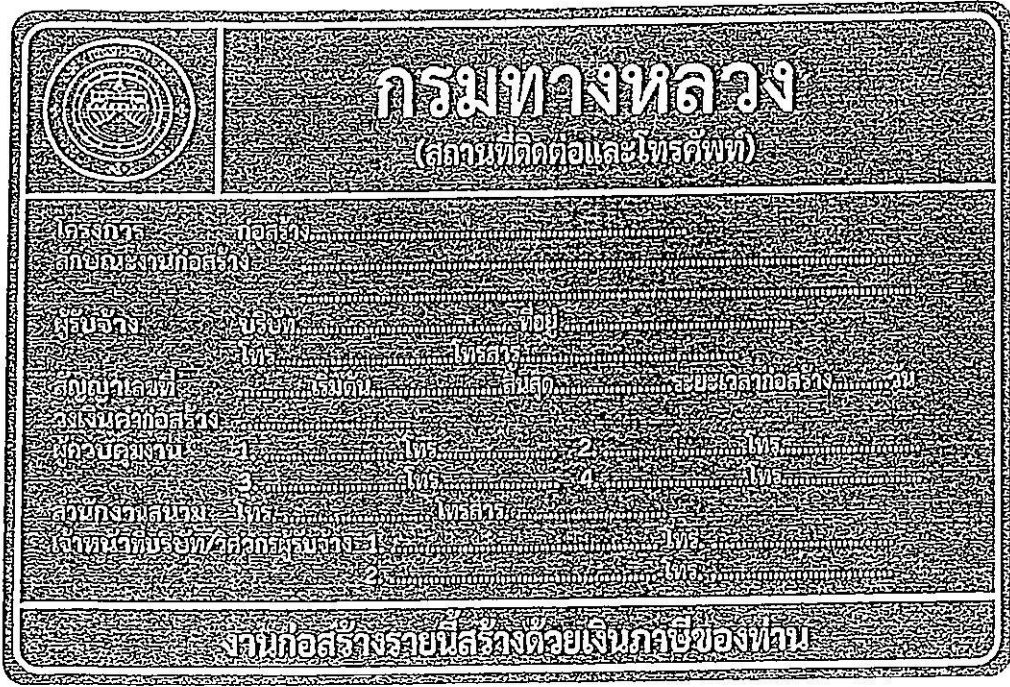
รูปที่ 2-8 ป้ายโครงการก่อสร้างขนาดใหญ่

สรุปป้ายจราจรที่ใช้ในงานก่อสร้าง งานบูรณะ และงานบำรุงรักษา ทางหลวงแผ่นดินในแต่ละพื้นที่ก่อสร้างแสดงในตารางที่ 2-1