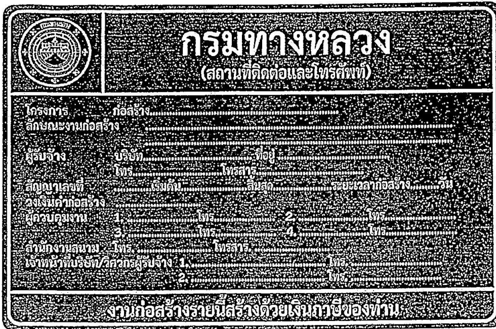
รูปที่ 2-8 ป้ายโครงการก่อสร้างขนาดใหญ่

สรุปป้ายจราจรที่ใช้ในงานก่อสร้าง งานบูรณะ และงานบำรุงรักษา ทางหลวงแผ่นดินในแต่ละพื้นที่ก่อสร้างแสดงในตารางที่ 2-1