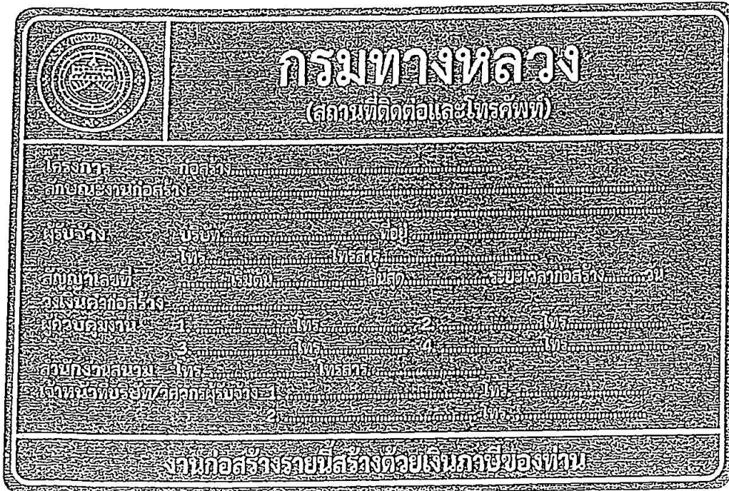
รูปที่ 2-8 ป้ายโครงการก่อสร้างขนาดใหญ่

สรุปป้ายจราจรที่ใช้ในงานก่อสร้าง งานบูรณะ และงานบำรุงรักษา ทางหลวงแผ่นดินในแต่ละพื้นที่ก่อสร้างแสดงในตารางที่ 2-1