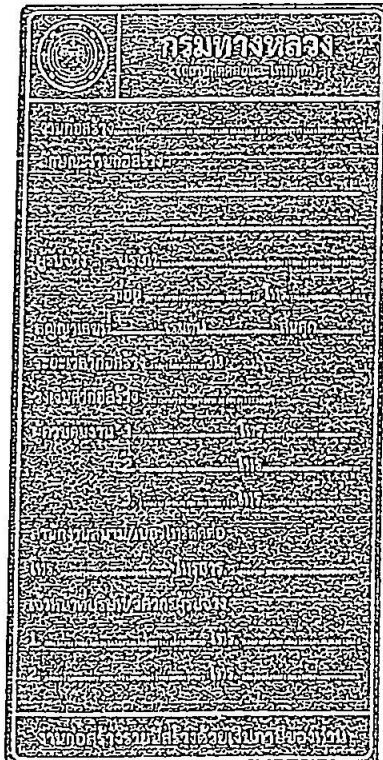
รูปที่ 2-7 ป้ายโครงการก่อสร้างขนาดเล็ก

ส่วนขนาดตัวหนังสือให้ใช้ขนาดตามรูปที่ 2-7 และรูปที่ 2-8