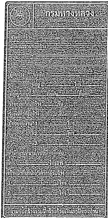
รูปที่ 2-7 ป้ายโครงการก่อสร้างขนาดเล็ก

ส่วนขนาดตัวหนังสือให้ใช้ขนาดตามรูปที่ 2-7 และรูปที่ 2-8