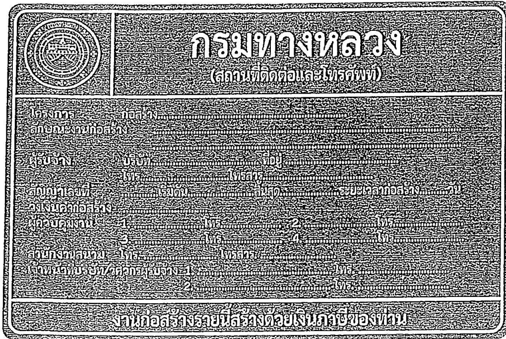
รูปที่ 2-8 ป้ายโครงการก่อสร้างขนาดใหญ่

สรุปป้ายจราจรที่ใช้ในงานก่อสร้าง งานบูรณะ และงานบำรุงรักษา ทางหลวงแผ่นดินในแต่ละพื้นที่ก่อสร้างแสดงในตารางที่ 2-1