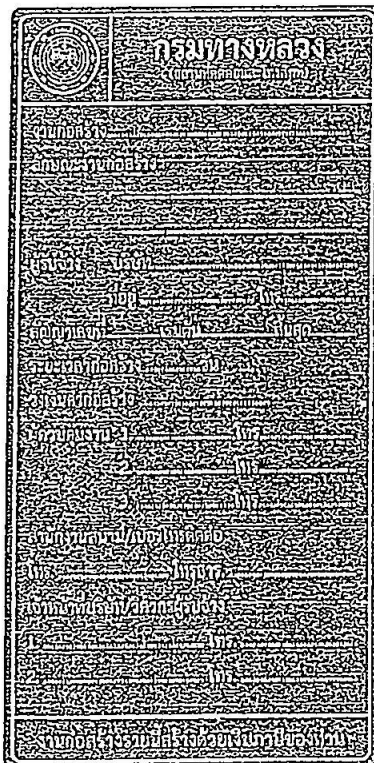
รูปที่ 2-7 ป้ายโครงการก่อสร้างขนาดเล็ก

ส่วนขนาดตัวหนังสือให้ใช้ขนาดตามรูปที่ 2-7 และรูปที่ 2-8