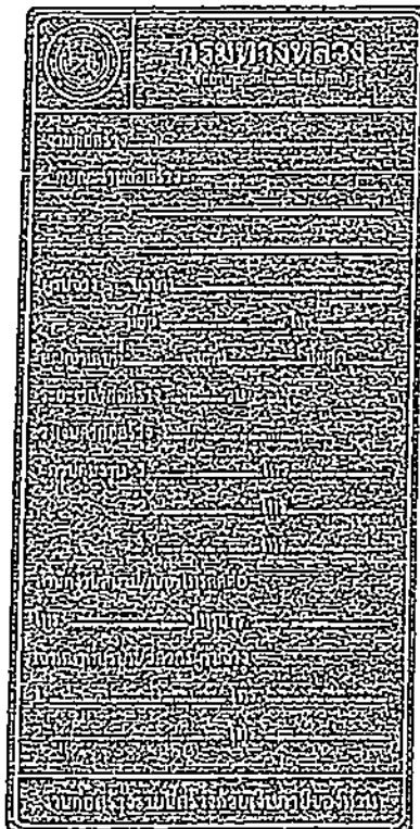
รูปที่ 2-7 ป้ายโครงการก่อสร้างขนาดเล็ก

ส่วนขนาดตัวหนังสือให้ใช้ขนาดตามรูปที่ 2-7 และรูปที่ 2-8