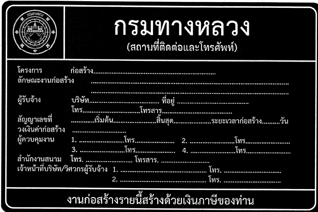
รูปที่ 2-8 ป้ายโครงการก่อสร้างขนาดใหญ่