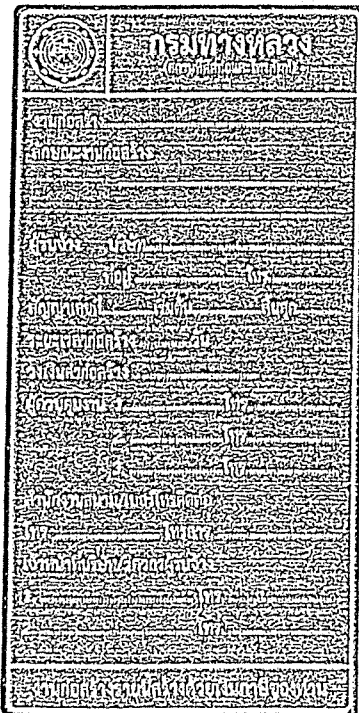
รูปที่ 2-7 ป้ายโครงการก่อสร้างขนาดเล็ก

ส่วนขนาดตัวหนังสือให้ใช้ขนาดตามรูปที่ 2-7 และรูปที่ 2-8