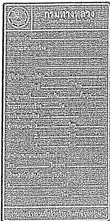
รูปที่ 2-7 ป้ายโครงการก่อสร้างขนาดเล็ก

ส่วนขนาดตัวหนังสือให้ใช้ขนาดตามรูปที่ 2-7 และรูปที่ 2-8