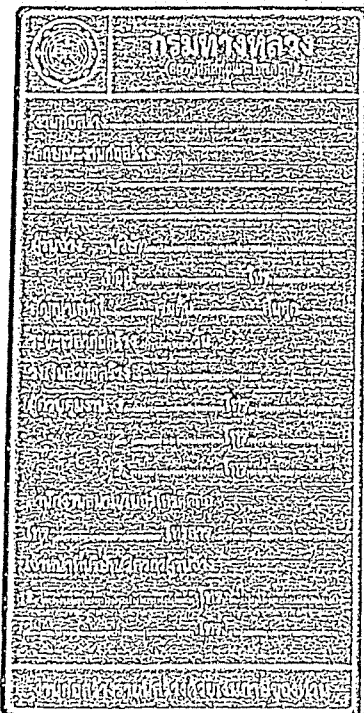
รูปที่ 2-7 ป้ายโครงการก่อสร้างขนาดเล็ก

ส่วนขนาดตัวหนังสือให้ใช้ขนาดตามรูปที่ 2-7 และรูปที่ 2-8