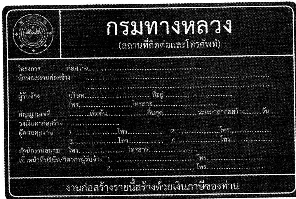
รูปที่ 2-8 ป้ายโครงการก่อสร้างขนาดใหญ่