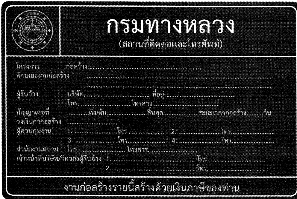
รูปที่ 2-8 ป้ายโครงการก่อสร้างขนาดใหญ่