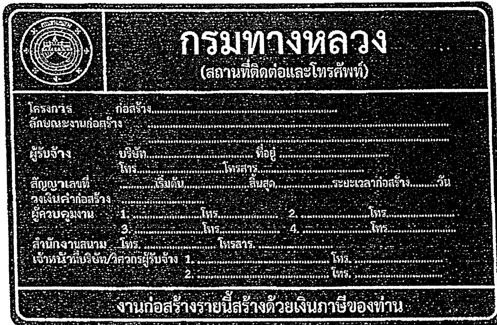
รูปที่ 2-8 ป้ายโครงการก่อสร้างขนาดใหญ่

สรุปป้ายจราจรที่ใช้ในงานก่อสร้าง งานบูรณะ และงานบำรุงรักษา ทางหลวงแผ่นดินในแต่ละพื้นที่ก่อสร้างแสดงในตารางที่ 2-1