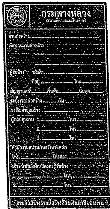
รูปที่ 2-7 ป้ายโครงการก่อสร้างขนาดเล็ก

ส่วนขนาดตัวหนังสือให้ใช้ขนาดตามรูปที่ 2-7 และรูปที่ 2-8