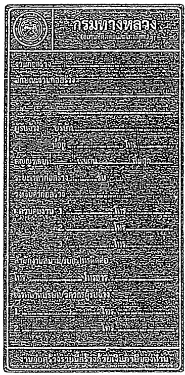
รูปที่ 2-7 ป้ายโครงการก่อสร้างขนาดเล็ก

ส่วนขนาดตัวหนังสือให้ใช้ขนาดตามรูปที่ 2-7 และรูปที่ 2-8