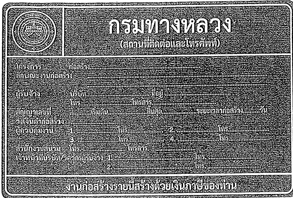
รูปที่ 2-8 ป้ายโครงการก่อสร้างขนาดใหญ่

สรุปป้ายจราจรที่ใช้ในงานก่อสร้าง งานบูรณะ และงานบำรุงรักษา ทางหลวงแผ่นดินในแต่ละพื้นที่ก่อสร้างแสดงในตารางที่ 2-1