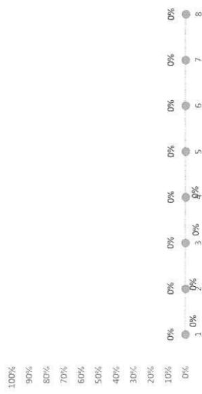
Legend: ■ % ACC PLAN, ● % ACC ACTUAL