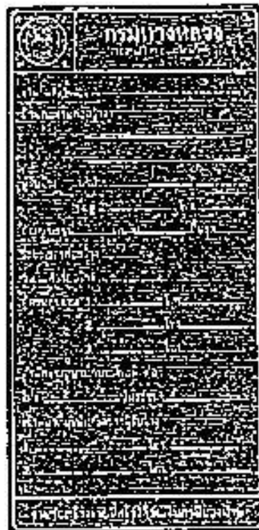
รูปที่ 2-7 ป้ายโครงการก่อสร้างขนาดเล็ก

สมรณะกดตัวหนังสือให้ใช้ขนาดตามรูปที่ 2-7 และรูปที่ 2-8