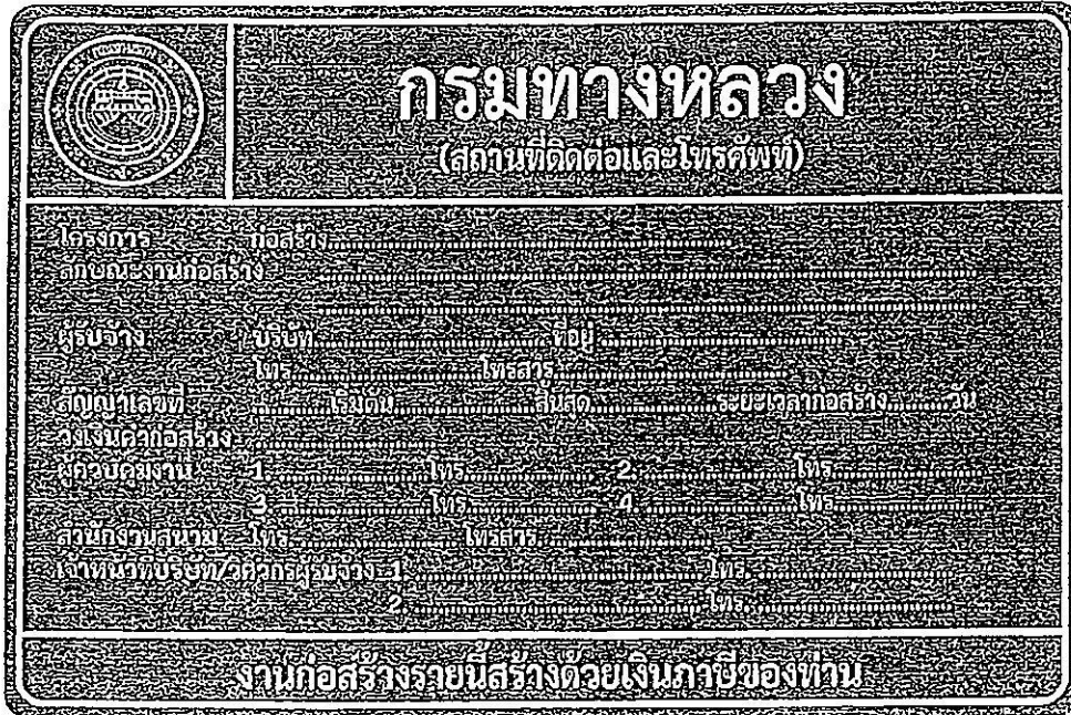
รูปที่ 2-8 ป้ายโครงการก่อสร้างขนาดใหญ่

สรุปป้ายจราจรที่ใช้ในงานก่อสร้าง งานบูรณะ และงานบำรุงรักษา ทางหลวงแผ่นดินในแต่ละพื้นที่ก่อสร้างแสดงในตารางที่ 2-1