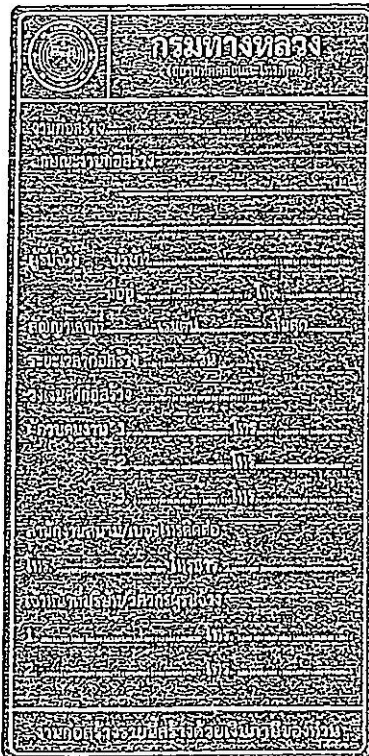
รูปที่ 2-7 ป้ายโครงการก่อสร้างขนาดเล็ก

ส่วนขนาดตัวหนังสือให้ใช้ขนาดตามรูปที่ 2-7 และรูปที่ 2-8