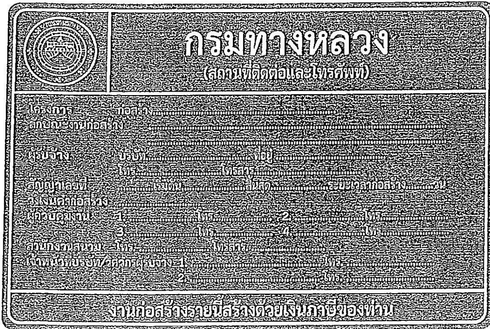
รูปที่ 2-8 ป้ายโครงการก่อสร้างขนาดใหญ่

สรุปป้ายจราจรที่ใช้ในงานก่อสร้าง งานบูรณะ และงานบำรุงรักษา ทางหลวงแผ่นดินในแต่ละพื้นที่ก่อสร้างแสดงในตารางที่ 2-1